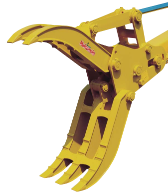
エムエーシー チルト式フォーククロー