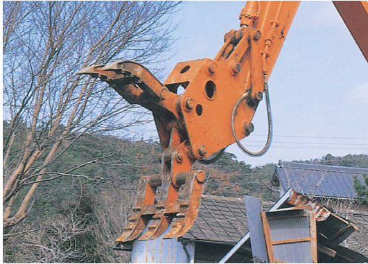
日立建機 チルト式フォークグラップル