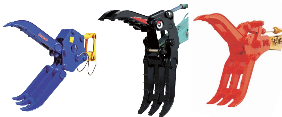
エムエーシー フォークロー MDP