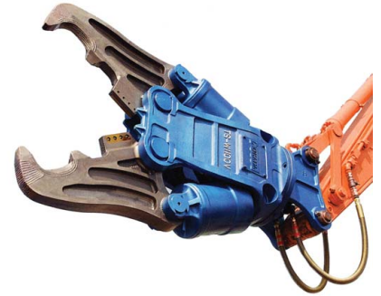
オカダアイオン TS-Wクラッシャー