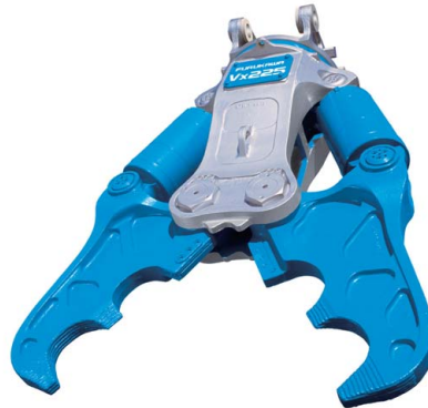
古河ロックドリル Vx225