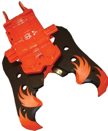
日本ニューマチック工業 圧砕機Sシリーズ